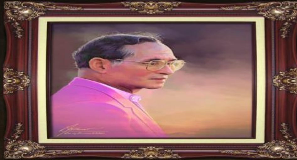
ศิลปิน : สุวิทย์ ใจป้อม

“...การที่จะทำงานเพื่อความมั่นคงและก้าวหน้านั้น มิใช่จะก้มหน้าก้มตาทำหน้าที่ของแต่ละคนเท่านั้น จะต้องมีความร่วมมือสัมพันธ์กันระหว่างหน่วยงานทุกหน่วย เพื่อให้งานรุดหน้าไปพร้อมเพรียงกัน...”